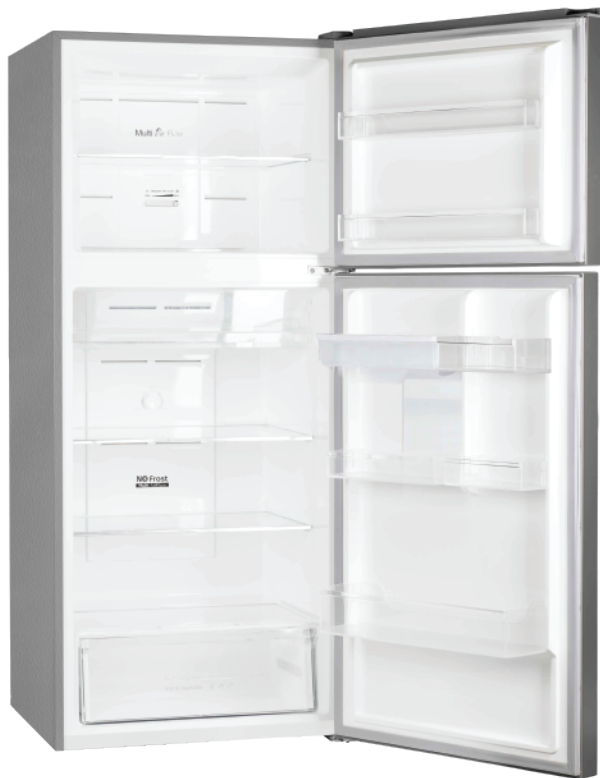
*Fotografías de referencias